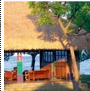
Direkt am Strand: Puri Ganesha.

PEMUTERAN. Schon Star-Designer Matthew Williamson planschte im Pool einer der vier Puri-Ganesha-Villen und liess sich von der exquisiten Küche verwöhnen. Das Resort liegt direkt am schwarzen Ko-