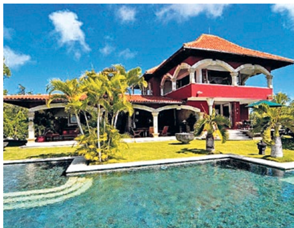
Die mit Privat-Pool ausgestatteten Canang-Sari-Villas sind ideal für Ruhesuchende.